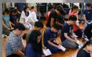
YM 大斋 犬组